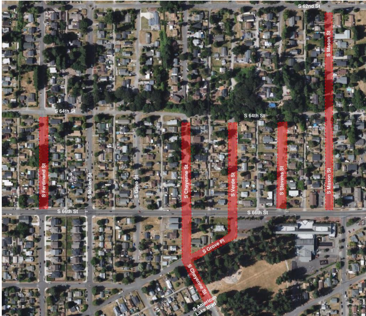
Схема 1-1: Карта району, де планується реалізація проекту

Проект «Зелена інфраструктура Маніту» — це проект із заміни інженерних комунікацій і доріг, за яким буде здійснено заміну наявних труб дощової, каналізаційної та питної води через їх старість і зношеність. Окрім заміни інженерних комунікацій у рамках цього проекту буде виконано повну реконструкцію проїжджої частини, включаючи встановлення бордюрних пандусів за Законом про американців з обмеженими можливостями (Americans with Disabilities Act, ADA), там, де зараз є тротуар. На схемі 1-1 червоним кольором виділено приблизний обсяг проекту.